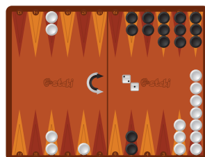
Κίνηση 4: 10 -> 8, 2->1