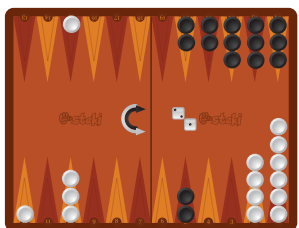
Κίνηση 3: 10 -> 3