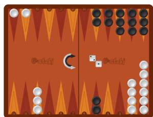
Κίνηση 1: 15 -> 14, 15->13

Τα πιθανά στιγμιότυπα μετά την κίνηση των λευκών είναι τα εξής: