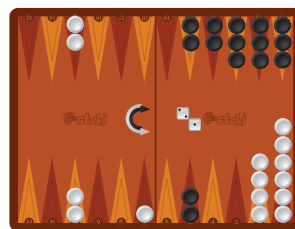
Κίνηση 5: 10 -> 7